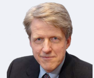
耶魯大學經濟學 羅伯·席勒 教授 Professor Robert J. Shiller