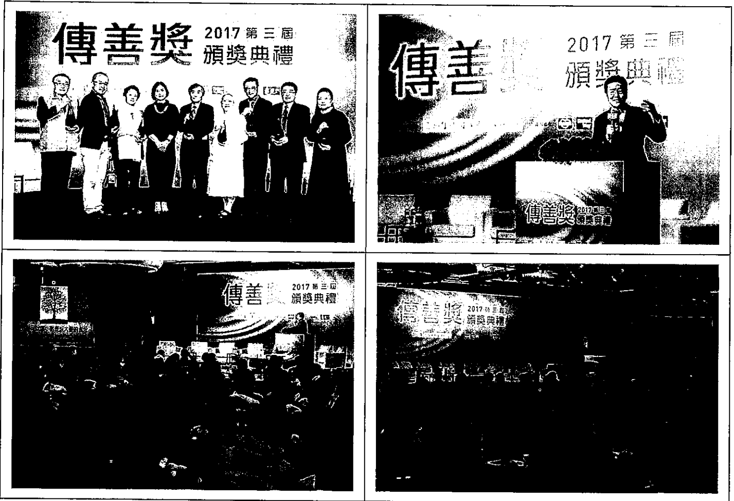
委由琉璃工房為得獎機構製作傳善獎獎座。

2017年11月23日(四)14:30~16:30 於台北君悅酒店3樓凱悅廳，現場有得獎機構、關心公益民眾、遠見讀者、媒體，約350位參加。